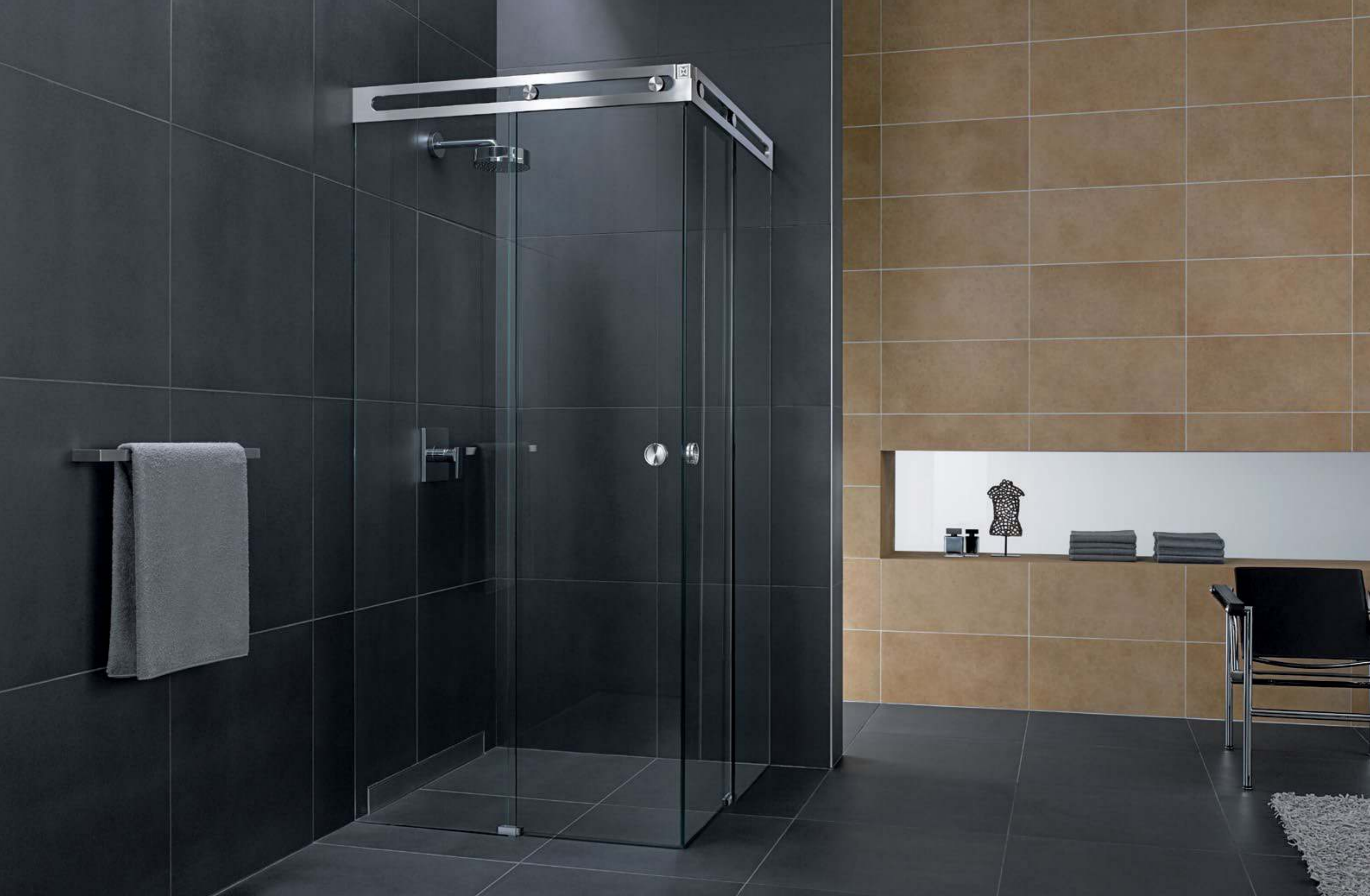
Duschsystem Luna Eckvariante