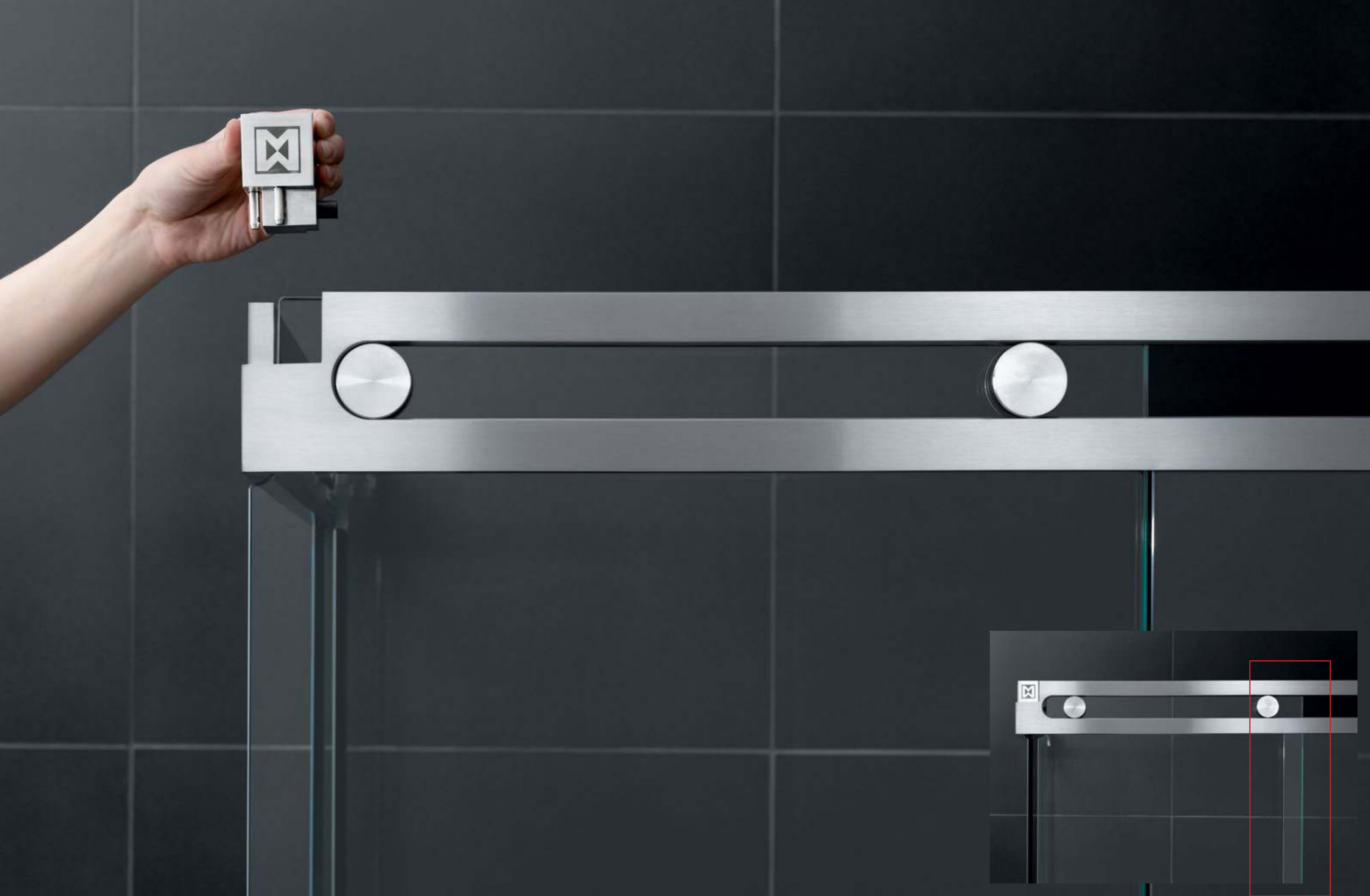
Duschsystem Luna Zum Reinigen kann man bequem den Stopper herausnehmen und die Schiebetür ganz öffnen, so dass der Glasüberstand beseitigt wird