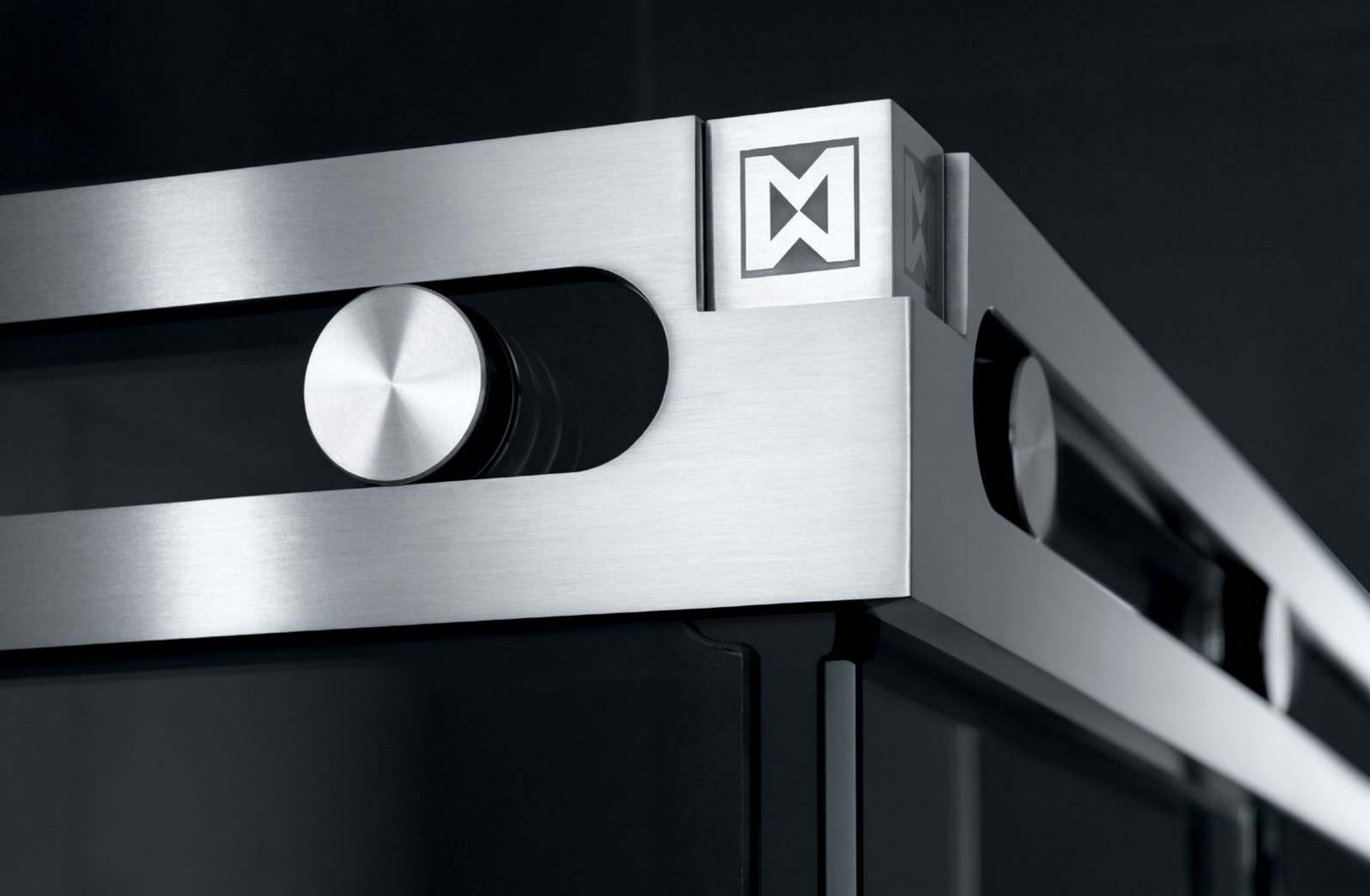
Duschsystem Luna Eckvariante